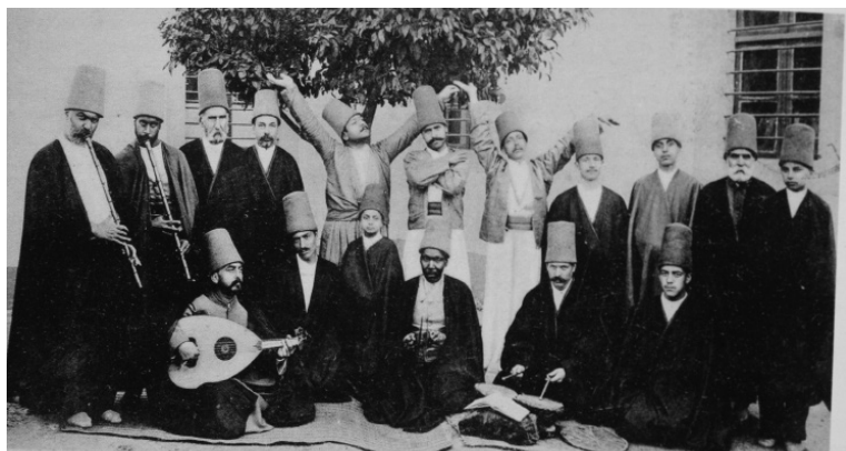
Δερβισηδες του τεκέ των Μεβλεβήδων στα Χανιά το 1910